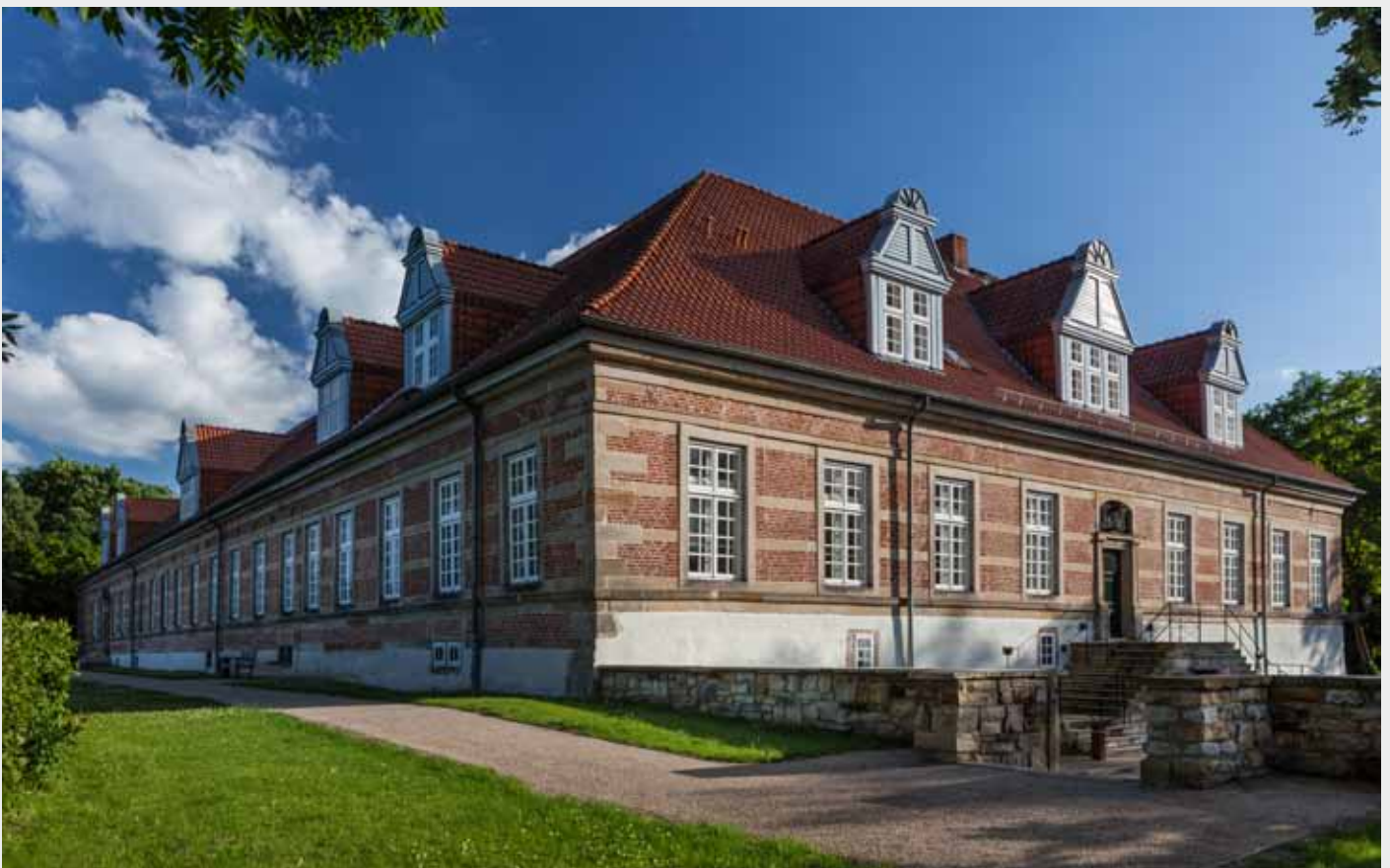
Blick auf Eingang + Kaminszimmer

Die Eigenschaften von Wasser, das natürliche Fließverhalten von in Wasser gelöster Tusche sowie die damit verbundenen Spuren und Formen bilden die Grundlage meiner Arbeiten. Tusche, durch Luftbewegung getrieben, breitet sich aus; dadurch werden Bewegungsspuren sichtbar. Dieses Verhalten folgt den Gesetzmäßigkeiten der Natur, wo Bewegung, Energie und Wachstum den Prozess der Formgebung bestimmen. Die Zeichnungen auf Büttenpapier sind in mehreren Schichten aufgebaut und wirken dadurch wie dreidimensionale Wandobjekte. Das in mehreren Lagen gerissene Büttenpapier lässt den Blick auf unterschiedliche Ebenen zu und offenbart Fragmente verborgener Tuschespuren.