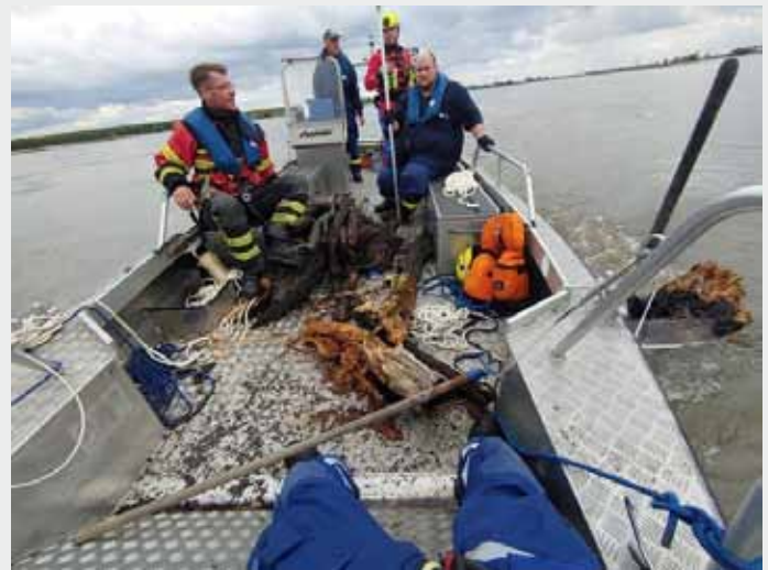
Kontrollfahrt der Deiche auf der Oder

Text, Fotos: THW Landesverband Berlin, Brandenburg, Sachsen-Anhalt