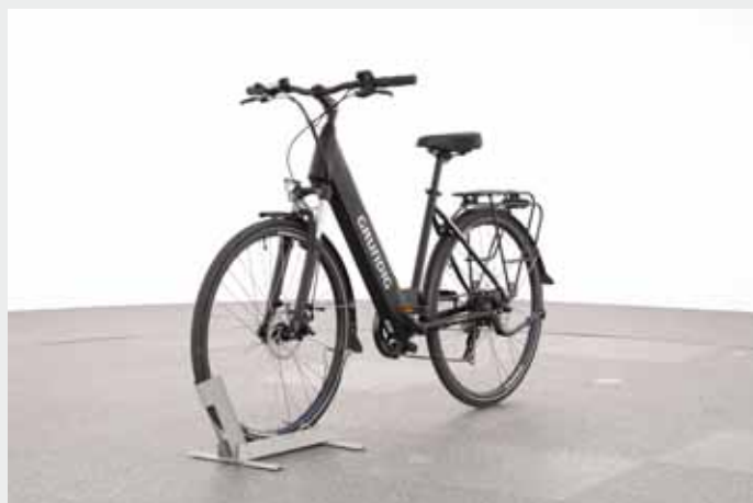
Grundig E-Citybike 28.