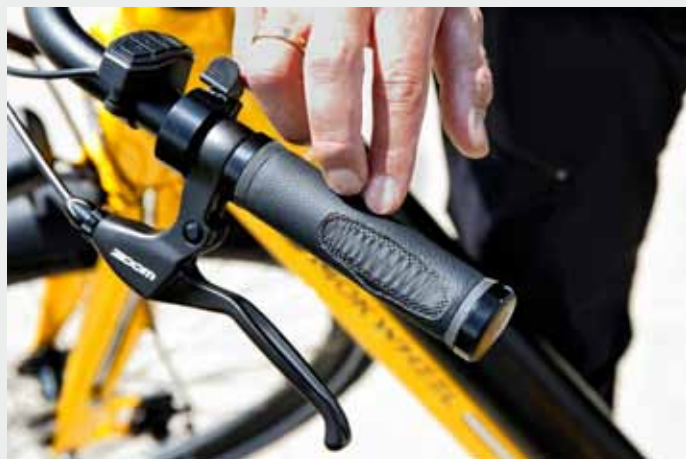
ADAC-Test Pedelecs: An den Griffen wurden die Schadstoffe untersucht.

Außerdem sind die Motoren teils laut und laufen nach, unterstützen also auch noch dann kurze Zeit, wenn man schon gar nicht mehr pedaliert. Damit ist weniger Kontrolle über das Rad möglich. Unbefriedigend