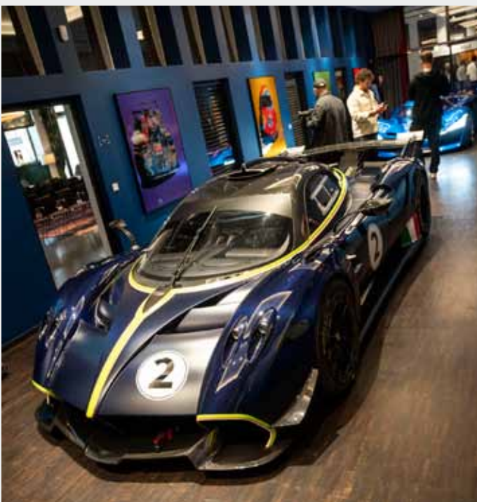
CDE 2026: Pagani.