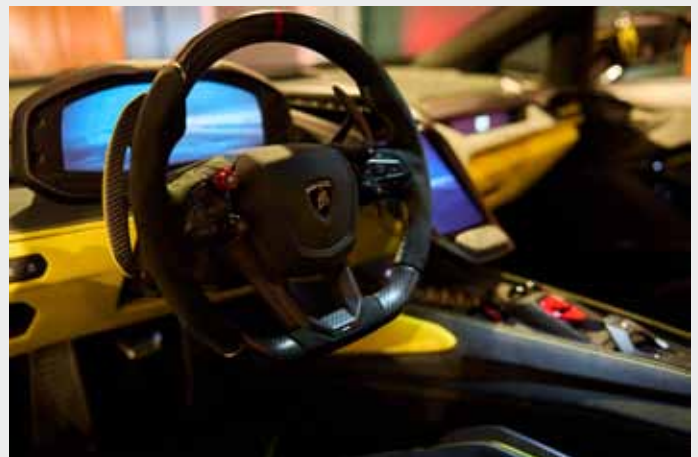
CDE 2026: Lamborghini.